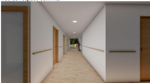
Vue du couloir vers les chambres | vue d'une chambre