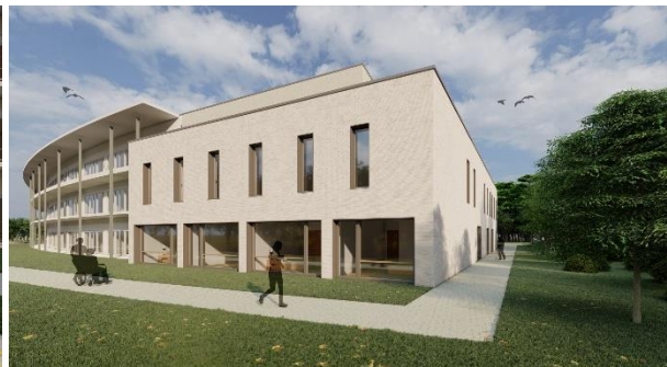
Vues extérieurs de l'extension bâtiment C