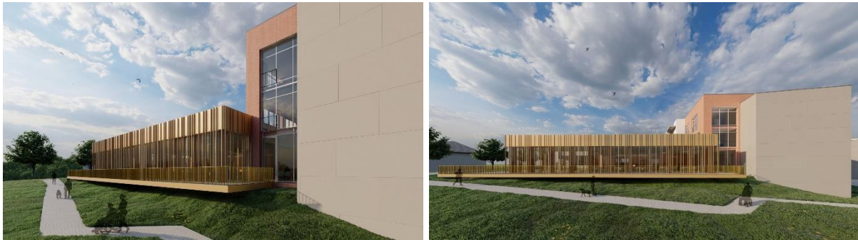
Vues extérieurs de l'extension du restaurant

Étant donné que l'extension vient s'accoler au bâtiment existant, elle diminue l'éclairage naturel à ces endroits. Pour remédier à cette situation, une façade entièrement vitrée avec des lamelles en aluminium est prévue pour garantir un maximum de luminosité et une vue vers l'extérieur. Des stores extérieurs en aluminium garantiront une protection solaire.