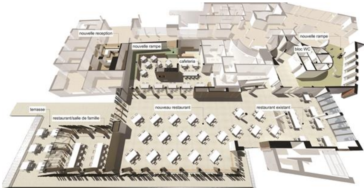
Perspective de la nouvelle situation avec les différents espaces