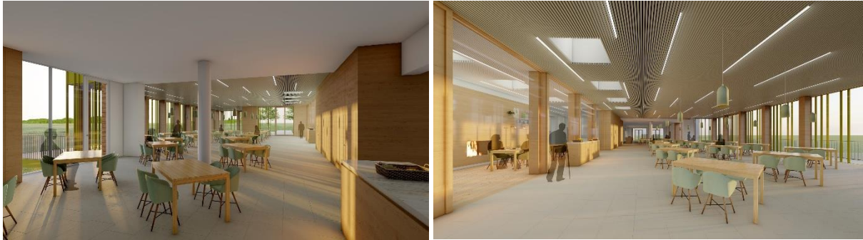
Vue du restaurant existant vers le nouveau | vue du nouveau restaurant vers cafétéria

La cafétéria comptera 40 places en plus avec un total de 76 places. Une cheminée fermée se trouvera au milieu de la salle afin de donner un confort en plus aux habitants.