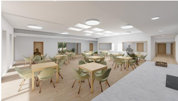
Vue de l'espace convivial

L'extension du bâtiment C va permettre 4 nouvelles chambres, des espaces conviviaux, une cuisine thérapeutique et une nouvelle infirmerie adaptée aux besoins des habitants. Celle-ci va se trouver en continuité du bâtiment existant.