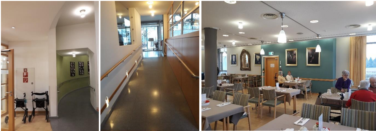
Rampes actuelles vers le restaurant/caféteria avec une pente de 7% et situation actuelle du restaurant

Avec une grande croissance du nombre des gens à mobilité réduite, les accès/rampes avec une pente de plus de 7% (pour combattre le dénivellement de 50cm vers le restaurant et cafétéria) ne sont plus fonctionnelles. L'espace entre les tables n'est plus suffisant pour passer avec une chaise roulante, mais aussi le nombre de tables est à présent très limité.