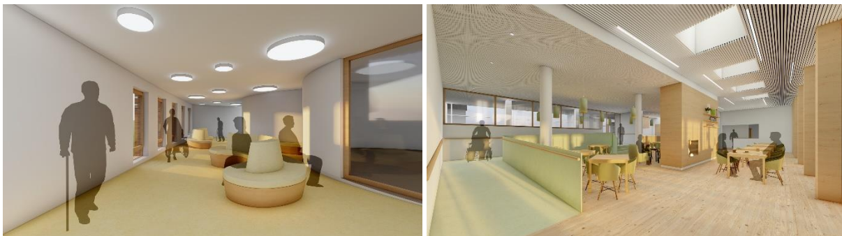
Vue de la nouvelle rampe vers le restaurant avec une zone d'attente/repos | vue de la nouvelle rampe dans la cafétéria

C'est pourquoi un nouveau concept doit être conçu. Deux nouvelles rampes, avec une pente de 3 et 4%, mènent dès lors vers le restaurant et la cafétéria, répondant ainsi aux nouvelles exigences. Ces rampes permettent une promenade continue entre le restaurant et la cafeteria créant aussi des zones de repos donnant un certain confort à ses habitants.