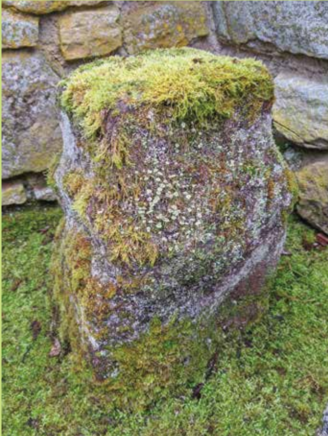
Guy & Gisela Clausse

Eng Auswiel vu schéine Fotoen aus der Gemeng dei mir erageschéckt kruten: