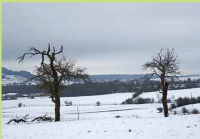
der Madame Nicole House