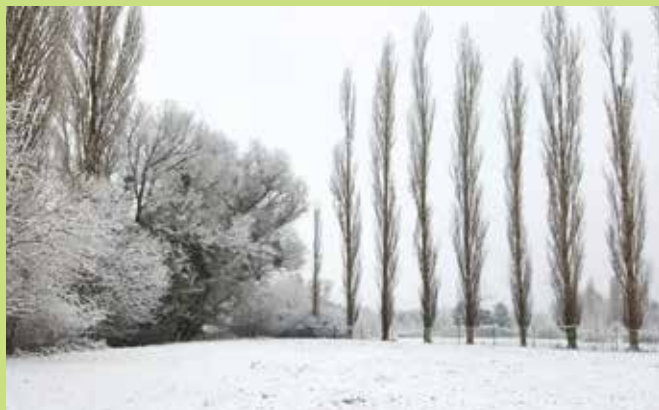
dem Här Aly Reuter