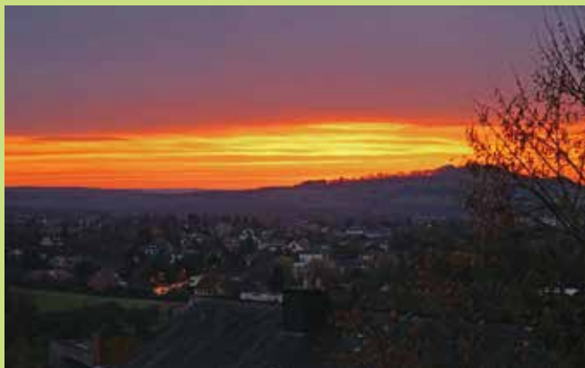
dem Här Erwin Esly